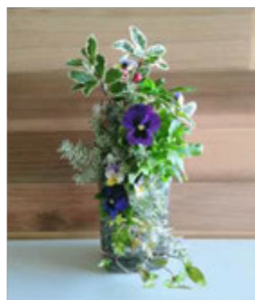
記事 田中 綺斗